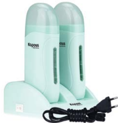
Воскоплав электрический двойной с базой для разогрева воска в картридже 2*100 мл Electric wax heater for refill 2*100 ml