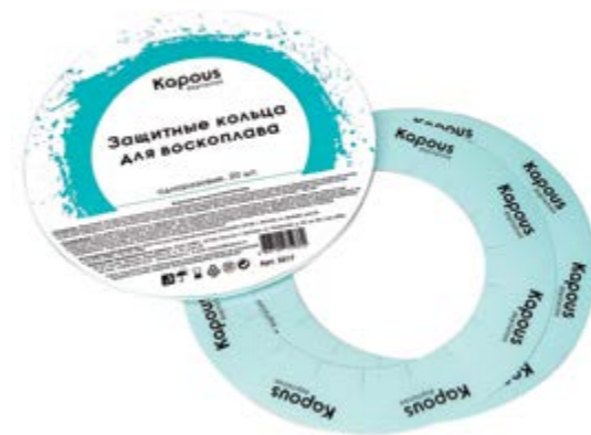
Защитные кольца для воскоплава Protective rings

Защитные кольца предназначены для предотвращения попадания расплавленного воска или разогретой сахарной пасты внутрь нагревателя и на корпус баночного воскоплава при проведении процедуры депиляции.