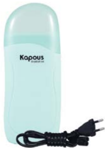
Воскоплав электроический для разогрева воска в картридже 100 мл Electric wax heater for refill 100 ml