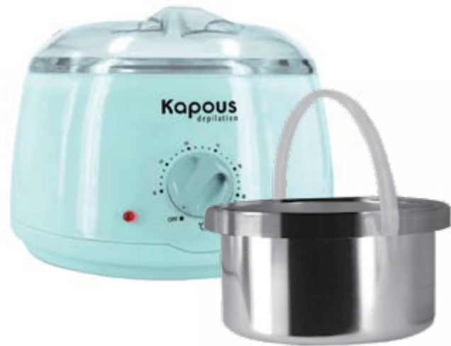
Воскоплав электрический для воска в банке 400 мл Electric wax heater for pot 400 ml